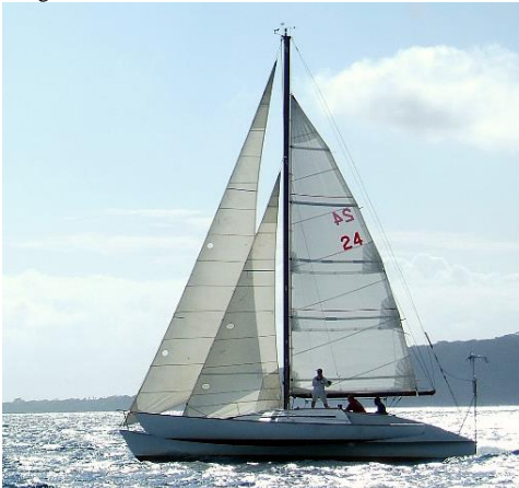
Naga toutes voiles dehors en direction de Darwin en 2012