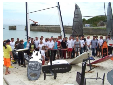
La semaine affoilante - Brigitte Gahagnon

Un rendez-vous d'engins volants et les Golden Oldies Multihulls, quel rapport ? Au départ je n'ai pas compris la proposition de Philippe de mettre un mot dans la newsletter, et puis en fin de compte ! C'est quoi cette Semaine affoilante ? Le projet de trois passionnés de foils qui décident de créer un rendez-vous dans l'esprit des semaines de vitesses des années 70 à 90. Un rendez-vous organisé