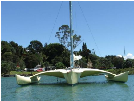
FLEET en Nouvelle Zélande