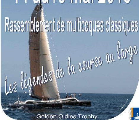
Golden Oldies Trophy